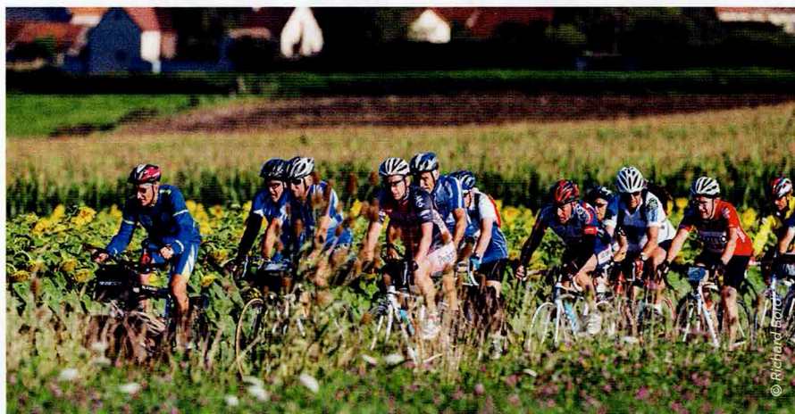
Pendant les vingt premiers kilomètres on roule ensemble avec comme repère l'allure du « maillon faible ».