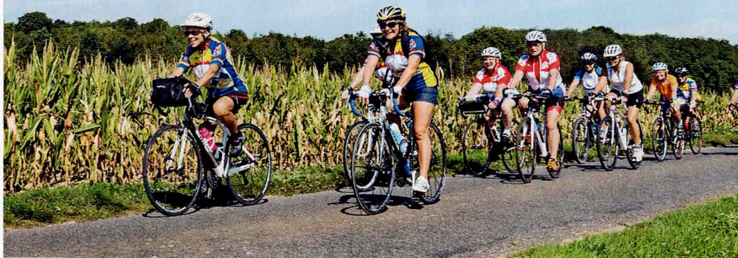
Tout le monde se regroupe pour faire redescendre la ventilation, pour un retour au calme, avant la pause hydratation de fin de parcours.

Retrouvez un article sur la même thématique, « La sortie du dimanche », dans la revue Cyclotourisme de janvier 2023 (n° 730).