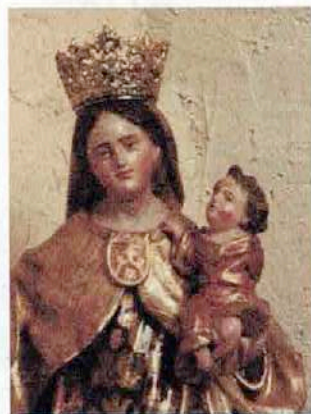
Vierge du carmel de Cadix du XVIII e siècle, église Saint-Pierre de Beynat

Pierre Beyne, célibataire, 28 ans, domestique