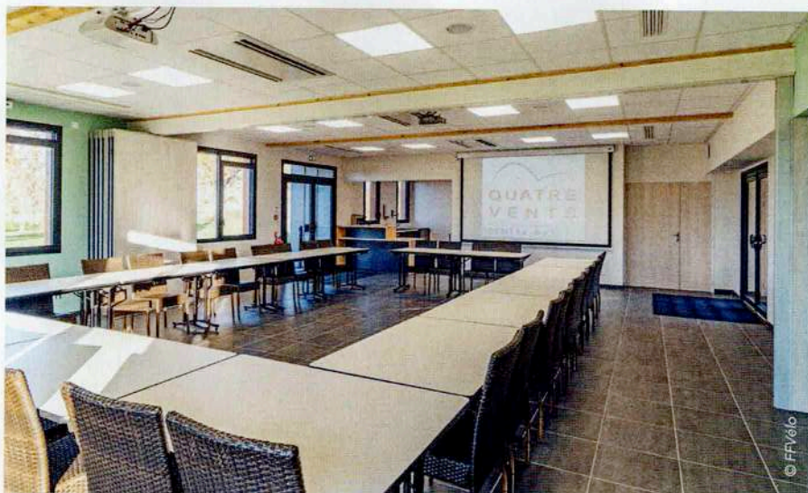
Le Centre nature « Quatre vents » accueille les élèves pour la partie théorie et pratique de la formation CQP « AMV ».

Dans la continuité du cursus de la formation fédérale des bénévoles (Initiateur, Moniteur, Instructeur) mais aussi pour répondre à une demande d'une part de nos structures, face à l'augmentation de la pratique du vélo dans le quotidien des Français et d'un besoin d'encadrement de la pratique de plus en plus important, et d'autre part, pour assurer la mise en des politiques publiques et plus particulièrement le « Savoir rouler à vélo » (SRAV), la Fédération française de cyclotourisme a décidé de s'engager vers la professionnalisation.